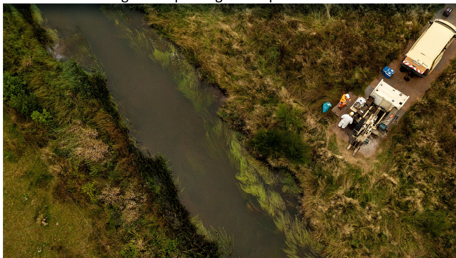
Geoprobe-boringer tæt ved Grindsted Å.

Der er også fuld gang i oprensningen af forureningen i Kærgård Klitplantage, som regionen i samarbejde med staten tog hul på i 2007. Den tilbageværende oprensning af grundvandet under gruberne ventes færdig i 2027, hvorefter det ventes at tage ca. 15 år, inden de sidste restriktioner for ophold i klitterne samt badefor-buddet ud for Kærgård Klitplantage kan ophæves.