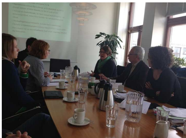
Møde med Ligestillingsafdelingen.

Det kunne være relevant at se på, om det vil give mening i højere grad at arbejde med kønsdata, dokumentation og effektmålinger i Region Syddanmark.