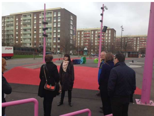
Besøg på Rosens Røde Tæppe.

Regionen er ansvarlig for en lang række byggerier og indretningen af både nybyggerier og eksisterende byggerier. Her kan det være interessant at se på, om man er opmærksom nok på bevidst at tænke i mere specifikke målgrupper for ikke ubevidst at ekskludere/ikke tage hensyn til bestemte grupper.